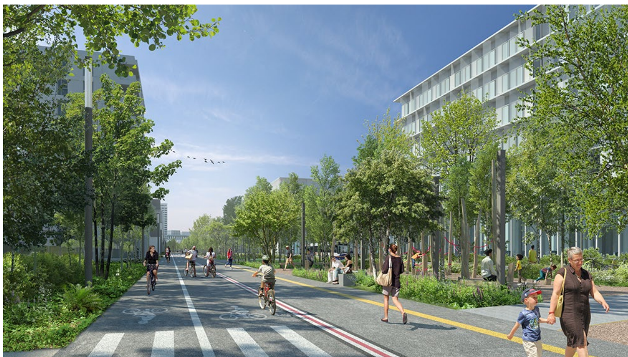
La Graine Studio - OLM