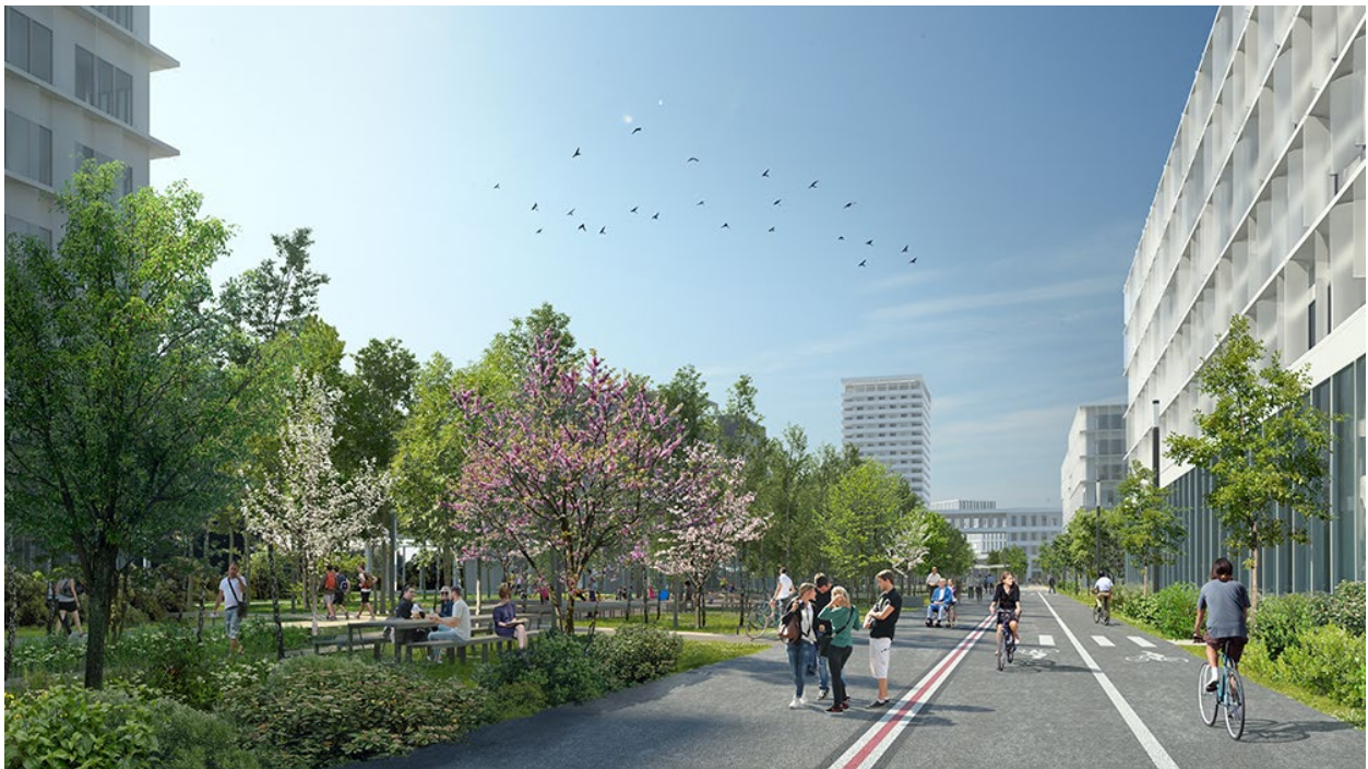
© La Graine Studio - OLM

D'ici à 2026, pour offrir un nouveau lieu de vie entre la place Marcel Bouilloux-Lafont au nord et le Campus d'Innovation au sud, 1 km de piste non-inscrite à l'inventaire des Monuments historiques sera métamorphosé en un grand parc linéaire généreusement planté de plus de 1 600 arbres et agrémenté de nombreux espaces dédiés aux loisirs et à la promenade.